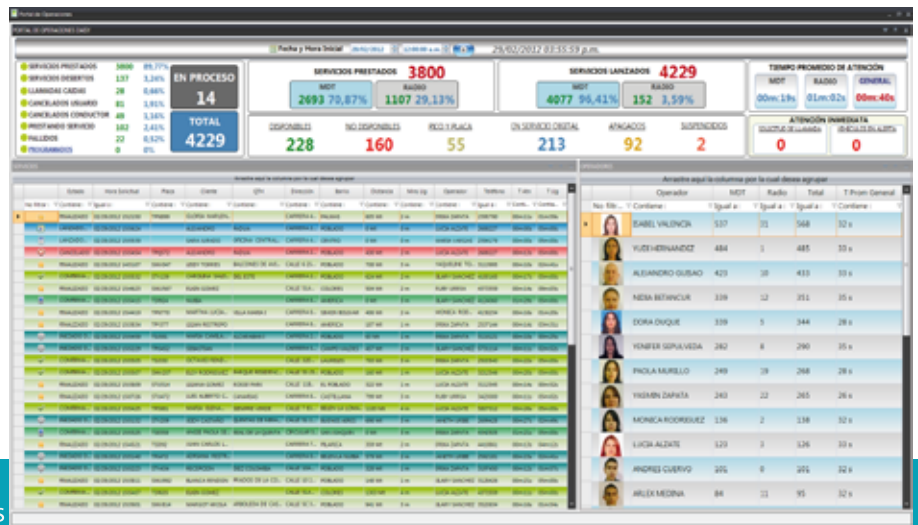
Portal de Operaciones